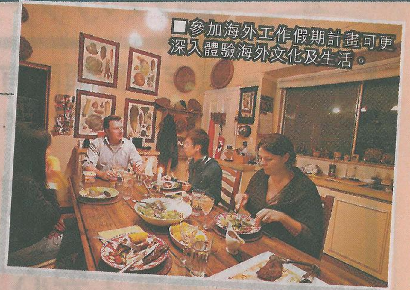
參加海外工作假期計畫可更深入體驗海外文化及生活。